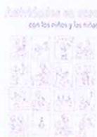
Actividades En Casa

70 ideas fáciles PARA JUGAR CON NIÑOS DENTRO DE CASA