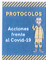
Protocolos de Acción frente al COVID-19